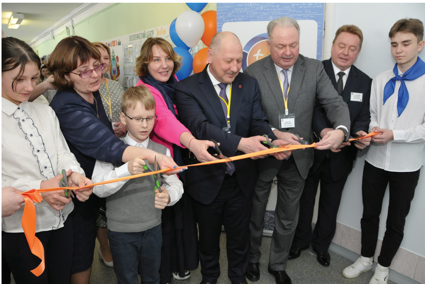
Открытие атомкласса в школе № 121