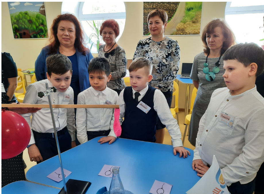
Лаборатория в школе № 135

школьнику возможность качественного образования в современных условиях, но и обустроить для детей точки роста — предметно-пространственные среды и атомклассы.