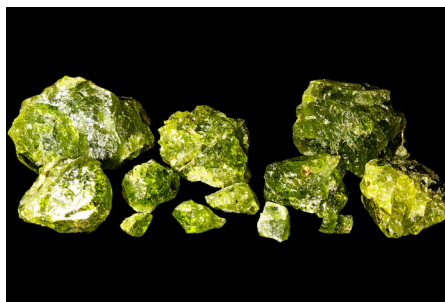
Снежинские апатиты — находки в Семи ключах