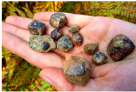
Гранаты-альмандины с Мохового болота

Обширное болото к югу от Лысой горы снежинцы посещают редко. Посреди него немногочисленные грибки то и дело натываются на свежие раскопы, которые неожиданно появляются и столь же неожиданно исчезают, наполняясь мутной болотной